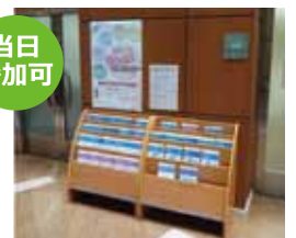
お問い合わせ/がん相談支援センター 1階「売店」前です